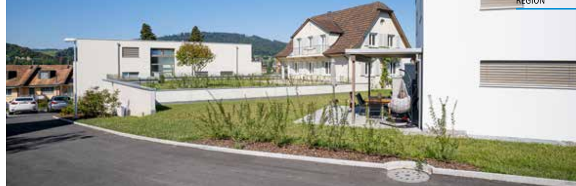
Das Ensemble mit dem neuen Mehrfamilien- und Einfamilienhaus mit dem bestehenden und renovierten Landhaus im Zentrum.

immovesta entwickeln entwerfen realisieren