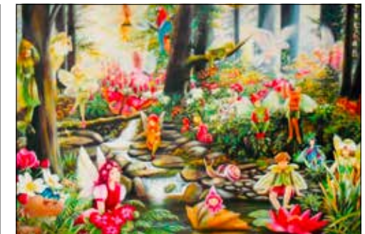
Musiktheater zum Thema «Fantasiewesen im Märchenwald».

Der 1. Block ELKI mit 10 Lektionen startet am 22. September 2022. Teilnehmen können Kinder im Alter von 1½ bis 4 Jahren, in Begleitung einer vertrauten Person.