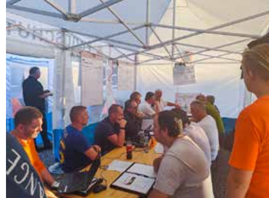
Angehörige des RFO und des Zivilschutzes beim Rapport (links). Die verantwortlichen Leiter bei der Übungsbesprechung.