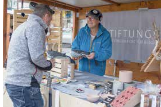
Der Herbstmärt hatte wieder viel zu bieten. Auch die aktive Betätigung war dabei an diversen Ständen möglich.