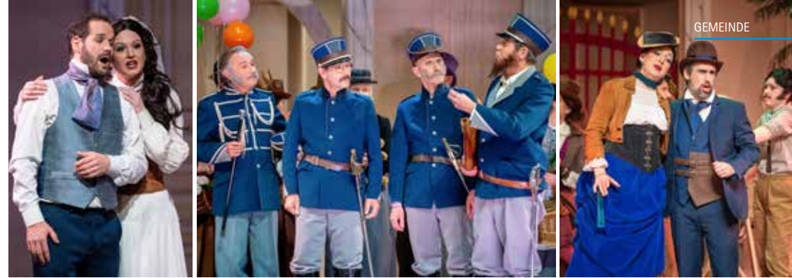
Sehr gut besetzt: Das Ensemble sorgt zusammen mit allen anderen Akteuren auf der Bühne für eine Aufführung, die begeistert.