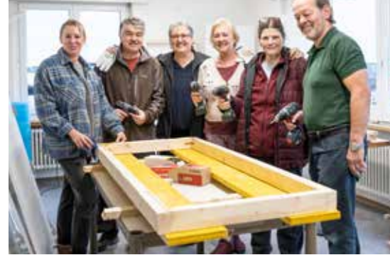
Das kleine und sehr engagierte Freiwilligen-Team beim Zimmern der Igelboxen in der Igelstation Dürrenäsch.