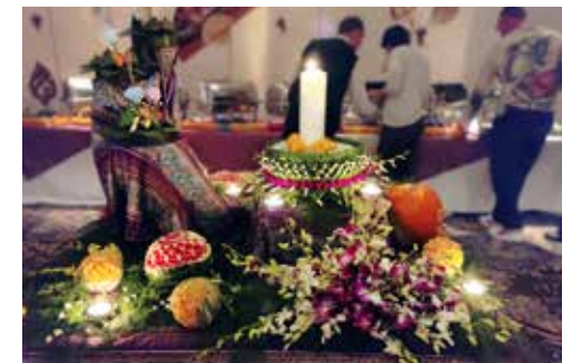
Viele fleissige Hände: Die aufwändigen Früchte- und Gemüseschnitzereien werden schon zwei Tage vor dem Anlass in Angriff genommen. Reservieren Sie Ihren Tisch unter Telefon 056 676 68 68 oder online.

Pouletschenkel, begleitet von Salaten und Suppen – ein königlicher Auftakt zur kulinarischen Reise. An den Live-Cooking-Stations werden pikanter grüner Papaya-Salat und thailändische Nudeln frisch zubereitet. Das warme Buffet mit Entenbrust, Rindfilet, Red-Curry-Crevetten und Thai-Gemüse bildet – neben dem Thai-Dessert als Finale – den Höhepunkt. Das Krathong-Ritual gehört genauso zum Abend wie eine musikalische Umrahmung durch die meditativen Klänge der «Kim». Haben wir Ihre Lust auf einen exotisch-asiatischen Abend mit fernöstlicher Kultur entflammt, dann feiern Sie mit, ab 18 Uhr in «Thailand am Hallwilersee».