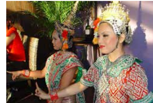
Begeistert die Gäste: das authentische Ambiente im Restaurant Samui-Thai, hier die Thai-Tänzerinnen in traditionellen Kostümen.

Eine Reise mit kunstvoll zelebriertem rotem Faden, visuell wie kulinarisch, erwartet die Gäste genauso am stimmungsvollen Fest im Samui-Thai. Gezeigt wird Handwerkskunst auf hohem Niveau, geschnittenes Gemüse und Früchte, tausende Jasminblüten, verarbeitet zu Girlanden und selbst die Krathongs aus Bananen- und Bambusblättern liebevoll eingepackt und mit Blumenblüten verziert. Drei Buffets bilden den Rahmen zum kulinarischen Auftritt von Entenbrust, Doradenfilet, Thai-Gemüse und Co. Reichhaltig die Vorspeisen – marinierte Rindfleisch-Satay-Spiesschen, Frühlingsrollen, Crevetten-Küchlein und in Pandanusblätter gewickelte