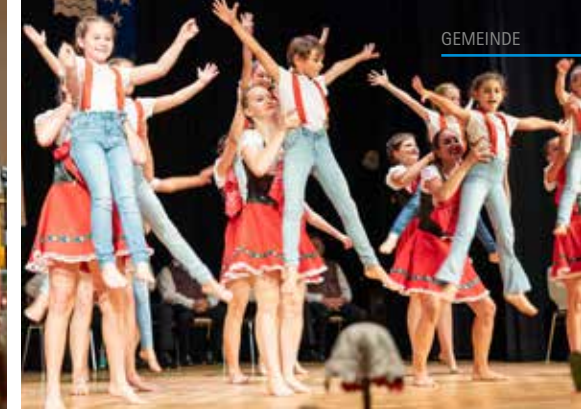
Gastauftritt von zwei Gruppen des val.danza Tanzvereins Seetal.