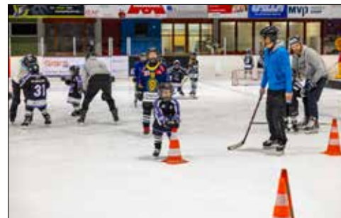
Erste Bekanntschaften mit dem Eis in der Hypi-Hockeyschule.

Am Samstag, 21. Oktober um 9 Uhr startete die Hypi-Hockeyschule in der Eishalle in Reinach in die neue Saison. Mädchen und Knaben im Alter von vier bis zehn Jahren konnten beim Eishockey hineinschnuppern. Spielend lernen sie sich auf dem Eis zu bewegen und erhalten von erfahrenen Trainern und Spielern hilfreiche Tipps.