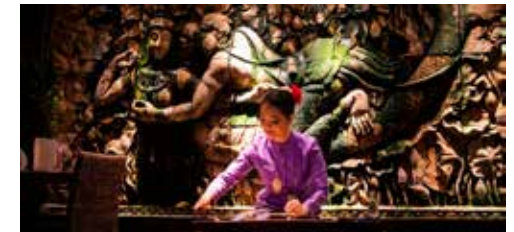
Die verführerischen Klänge auf der «Kim» machen das Loi Krathong zum stimmungsvollen Abend.

(Eing.) – Sawasdee. Am 23. und 24. November ist es im authentischen Thai-Restaurant am Hallwilersee wieder so weit. In der Vollmondnacht des 12. Mondmonats verwandeln sich Flüsse, Teiche und Kanäle in ganz Thailand in wahre Lichtergärten. Feierlich, mit einem leichten Stoss, werden sogenannte Krathongs ins Wasser gesetzt und auf ihre Gedanken-Reise geschickt.