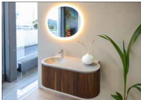
Exklusive Badmöbel stehen im Showroom zum Bestaunen bereit.

(dah) – Bei einem Umbau tauchen bereits bei der Planung viele Fragen auf. Unsicherheiten, wie es schlussendlich aussehen könnte oder welche Materialien die geeignetsten sind, stellen die Bauherrschaft vor Fragen. Dank des Gemeinschaftswerks der Firma Hug Sanitär + Heizung AG und Malermeister Gloor können einige Details nun im neu erstellten Showroom vor Ort besichtigt und besprochen werden. Pünktlich zu den Haustechtagen 2023, an der 26 Aussteller in der Deutschschweiz beteiligt waren, wurde der Showroom fertiggestellt. Dabei wird schnell klar, mit welchen Kernkompetenzen die beiden Firmen aufwarten können. Von der Planung und Beratung über die Bemusterung bis zur Umsetzung wird alles aus einer Hand angeboten. Mithilfe des 3D-Badplanungsprogramms kann detailgetreu aufgezeigt werden, wie das Bad schlussendlich aussehen wird. Zudem zeigt die Ausstellung, wie verschie-