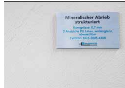
Wandbeschichtungen in zahlreichen Variationen.

Doch nicht nur einzelne Details oder Armaturen können im Showroom besichtigt werden. Auch die exklusiven Wandbeschichtungen, welche durch Malermeister Gloor erstellt wurden, geben einen Einblick in die vielfältigen Möglichkeiten. Die fugenlose Beschichtung Naturofloor eignet sich ideal, um einzigartige Wand- oder Bodenbeschichtungen, sowohl im Nass-/Duschbereich als auch im Wohnbereich entstehen zu lassen. Die Verarbeitung erfolgt in einem genau definierten Arbeitsprozess, bei welchem mehrere Schritte von Hand appliziert werden. Es braucht Zeit und auch etwas Geduld, damit aus den hochwertigen mineralischen Materialien eine beständige, zeitlose, wertige und einzigartige Oberfläche entstehen kann. Die fugenlosen Beschichtungen sind sehr pflegeleicht und bieten Schimmel eine schlechte Ansiedlungsfläche. Da diese bei privaten Wohnräumen über Renovationsobjekte bis hin zu repräsentativen Geschäftsräumen eingesetzt werden können, entstehen grenzenlose Möglichkeiten. Dabei lässt sich mittels gewünschter Oberflächenstruktur und gewählter Farbnuance von der kühl-modernen Optik bis hin zur wohnlich-behaglichen Stimmung alles erzeugen. Der eidgenössisch diplomierte Malermeister beherrscht die Verarbeitung von Naturofloor perfekt und konnte