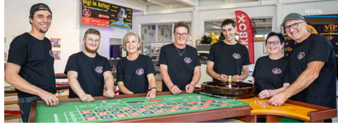
Mit ihm setzt man immer auf die richtige Karte: Das Team der Event Garage GmbH / Garage Graf AG im Casino Royale.

062 771 62 26 ODER HTTPS://CHROSIHUS.JIMDOFREE.COM