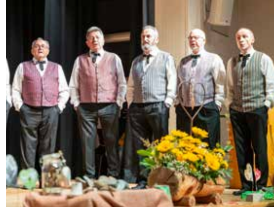
Ein perfekt organisierter Abend des Jodlerchörli Beinwil am See.