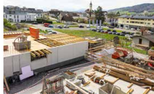
Am sonnigen Hang an bevorzugter Lage von Seengen entstehen zehn neue Terrassenhäuser mit einer perfekten Aussicht in die Landschaft.