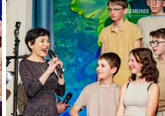
Grossartig, was der Jugendchor Seetal auch in diesem Jahr wieder leistet und auch Ständerätin Marianne Binder-Keller begeistert.