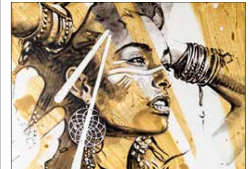
Bildausschnitt (Acryl auf Leinwand).

Tauchen Sie ein in eine analoge, sinnliche Welt, die in unserer modernen Zeit meist zu kurz kommt. Ein bestimmt empfehlenswerter Besuch, musikalisch untermalt von Tastenvirtuose Mega Horvath.