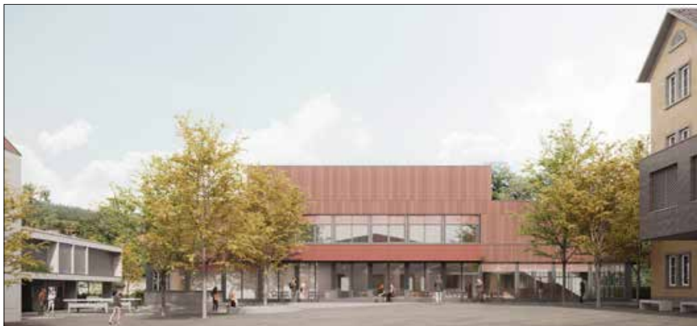
Im Schulhaus «Polifonia» in Seengen stehen der Kreismusikschule Seetal neben sechs grosszügig gestalteten Unterrichtsräumen auch eine moderne Aula für Konzerte zur Verfügung.

Die Regionale Musikschule Oberes Seetal mit den Gemeinden Bettwil, Fahrwangen, Meisterschwanden und Sarmenstorf sowie die Kreismusikschule Seengen mit den Gemeinden Boniswil, Egliswil, Leutwil und Seengen schliessen sich per 1. August 2023 zusammen.