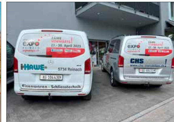
Der neueste Unimog wird an der WYNAexpo zu sehen sein. Die fahrenden Werbebotschafter (rechts) sind ab sofort unterwegs.