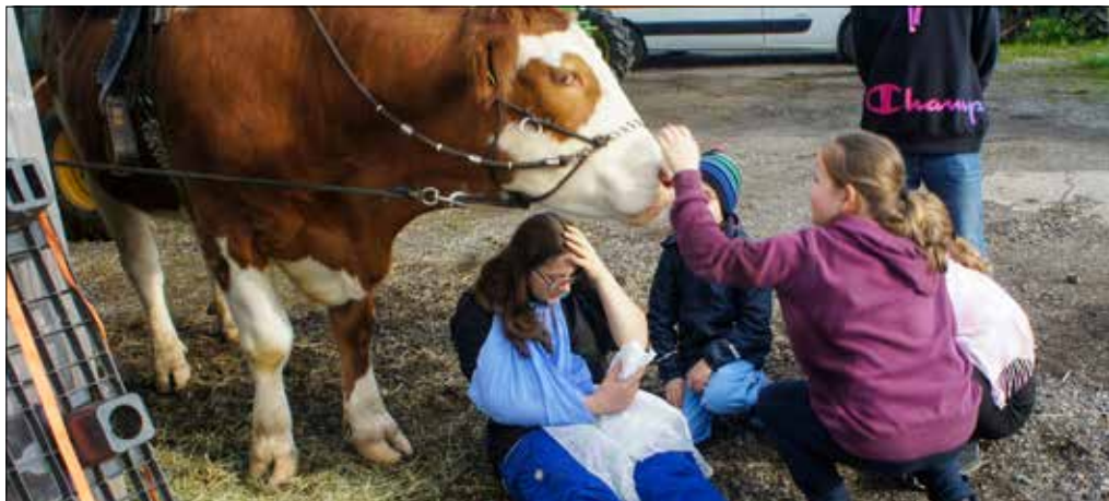
Die Help-Fox-Kinder betreuen eine vom Ochsen gestürzte Reiterin.

Während ihrer Help-Aussenübung auf dem Hof der Familie Birrer in Müswangen am 2. Mai zeigten 15 Help-Fox-Kinder der Samariter-Jugend Seetal an drei Beispielen, was sie bereits alles gelernt hatten. Erstaunlich viel, wie sich herausstellte.