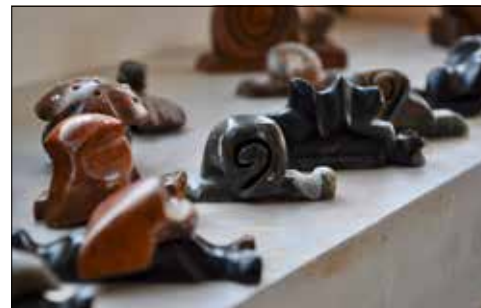
«Kunstgalerie» der Specksteinfliguren.

Auf dem Fenstersims vor Thomas' Arbeitsplatz im Kreativatelier der Stiftung Satis in Seon stehen seine «Wunsch-Männli». Das sind kunstfertig gestaltete Specksteinfliguren von unterschiedlichem Format: «Was diese Arbeiten betrifft, bin ich ehrgeizig.»