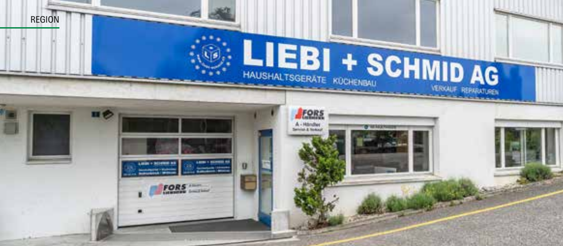
Haushaltgeräte und Küchenbau: Der Hauptsitz der Liebi + Schmid AG an der Degerfeldstrasse 9 in Schinznach-Dorf.