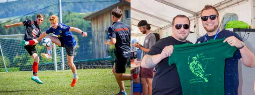
Begehrtes Sammlerstück: Das Hallwiler Grümpä-Shirt, das auch bei der Gastro-Crew seinen gebührenden Auftritt hatte.

(tmo.) – Schaut man sich in der Szene um, stellt man fest, dass die Grümpelturniere in der Region dünn gesät und frühere Traditionsanlässe gänzlich von der Bildfläche verschwunden sind. Das Haubuer Grümpeltturnier hat sie aber alle überlebt. Auch die Coronazeit. Und an Beliebtheit hat dieses sympathische Grümpä an nichts eingebüsst. Zehn Aktiv-, zwölf Fun- und sechs Sie & Er-Mannschaften standen bei der 29. Ausgabe im Einsatz und boten packenden Fussballsport. Nach dem Motto «All Jahr gmüetlech» soll der Spass am Fussballspielen im Vordergrund stehen. Aber auch beim Hallwiler Turnier zeigte sich: Hat der Schiri die Partie einmal angepfiffen, gibt es für die Teilnehmerinnen und Teilnehmer kein Halten mehr und der Ehrgeiz bricht da und dort durch – und zwar richtig. Geschenke werden dann auf dem Fussballfeld keine gemacht. So gesehen durften sich die Zuschauer an spannenden Begegnungen erfreuen. Freude über die Beteiligung und das Interesse herrschte auch beim