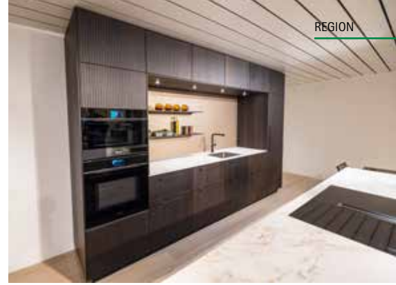
Neuste Küche im Showroom in Schongau.