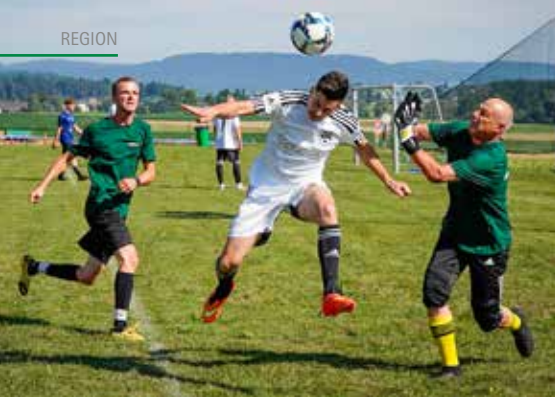
Packende Zweikämpfe: Obwohl der Plausch im Vordergrund stand, schenkten sich die Teams auf dem Spielfeld dann doch nichts.