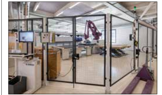
Vollautomatischer Zuschnitt der Einzelteile durch den Roboter.

fertig eingerichtete Küche sind bei der Furrer Küchen AG hoch. In der Ausstellung in Schongau oder in der Bauarena Volketswil kann die hohe Qualität begutachtet werden. Neben den Küchen entstehen je nach Kundenwunsch auch Bäder, Schrankanlagen, Garderoben, Tische oder Sideboards. Aber auch für weitere spezielle Wünsche ist man immer bereit. Ob für die anspruchsvolle Materialwahl oder den verwinkelten Raum, eine passende Lösung wird bei den Schongauer Holzprofis immer gefunden. Über eine Kontaktaufnahme freut sich das gesamte Team.