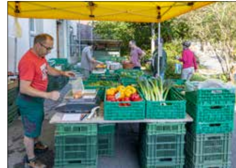
Jeden Freitag Verkauf ab Hof, frisch vom Feld.

Jeden Freitagmorgen herrscht reges Treiben auf dem Biobetrieb Knechtli & Sager an der Dürrenäscherstrasse 13 in Leutwil. Denn das frische und knackige Gemüse ist bei den Besuchern heiss begehrt. Stammkunden kommen jeden Freitagmorgen vorbei, um direkt ab Hof einzukaufen.