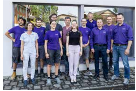
Ein Teil des Teams der Furrer Küchen AG.