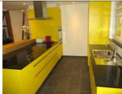
Küchenbau und Geräte-Ersatz