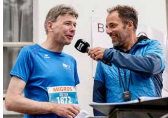
Regierungsrat Dieter Egli gut gelaunt beim Interview, bevor er als Starter amtierte und als Läufer den Halbmarathon absolvierte.

Hauptstrasse 17 • 5616 Meisterschwanden • 056 667 04 40 • www.mttz.ch