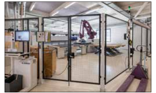
Vollautomatischer Zuschnitt der Einzelteile durch den Roboter.

fertig eingerichtete Küche sind bei der Furrer Küchen AG hoch. In der Ausstellung in Schongau oder in der Bauarena Volketswil kann die hohe Qualität begutachtet werden. Neben den Küchen entstehen je nach Kundenwunsch auch Bäder, Schrankanlagen, Garderoben, Tische oder Sideboards. Aber auch für weitere spezielle Wünsche ist man immer bereit. Ob für die anspruchsvolle Materialwahl oder den verwinkelten Raum, eine passende Lösung wird bei den Schongauer Holzprofis immer gefunden. Über eine Kontaktaufnahme freut sich das gesamte Team.