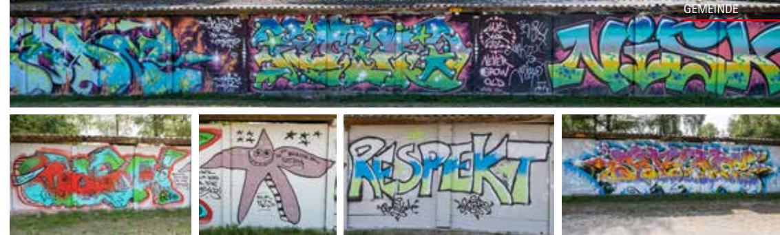
Bild oben: Aussenwand vorher, Bilder unten: Neu gesprayte Motive der Künstler und interessierten Besucher.