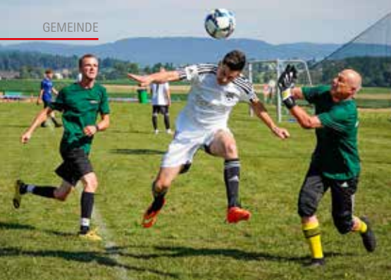
Packende Zweikämpfe: Obwohl der Plausch im Vordergrund stand, schenkten sich die Teams auf dem Spielfeld dann doch nichts.