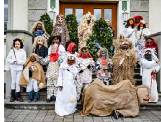
Der Bärzeli-Nachwuchs beim Fototermin auf der Treppe des Schul- und Gemeindehauses, bevor es auf die Umzugsroute ging.

Ihr TOYOTA CENTER im Seetal und Wynental