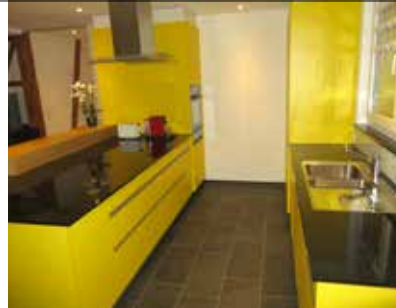
Küchenbau und Geräte-Ersatz