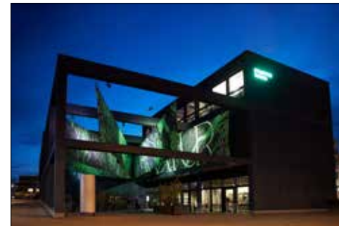
Das Stapferhaus am Bahnhof Lenzburg hat sich erneut verwandelt.

Im Stapferhaus in Lenzburg stehen die drängenden Fragen unserer Zeit im Fokus: Nach Geld, Heimat, Fake und Geschlecht widmet sich die aktuelle Ausstellung dem Thema Natur. Was oder wer ist Natur eigentlich? Wem gehört sie? Und müssen wir sie retten?