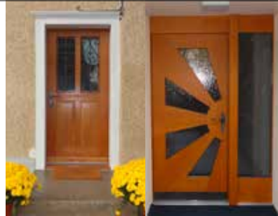
Haustüren nach Mass