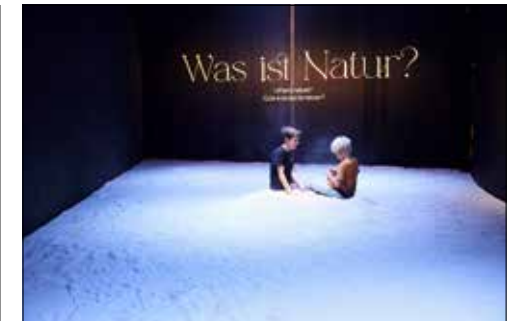
Spielerisches Entdecken der entscheidenden Frage unserer Zeit.

(Eing.) – «Natur. Und wir?» lädt zu einem poetischen Ausflug. Sie geht vom kritischen Zustand der Natur aus und führt zu einem neuen Blick auf sie. Und sie fordert dazu auf, das eigene Verhältnis zur Natur zu entdecken und mitzureden, wohin die Reise in Zukunft gehen soll.