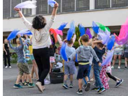
Fleissig am Üben: Alle Kindergartenkinder studieren einen Tanz ein.

Wir empfehlen uns auch für: Haus- und Wohngräumungen