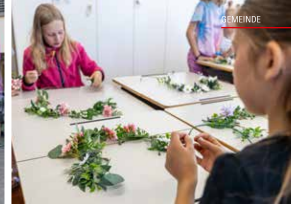
Die Kinder bereiten konzentriert ihre Kopfbedeckungen vor.