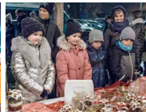
Um das Menziker Gemeindehaus herrschte eine zauberhaft weihnachtliche Stimmung, die viele Besucher anlockte.