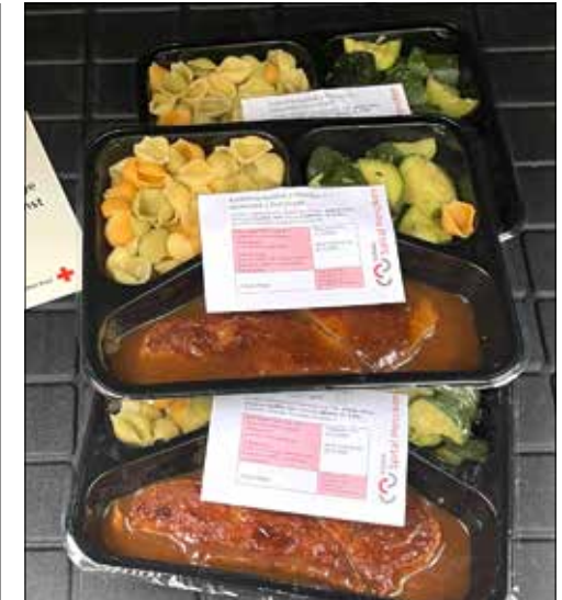
Der Fahrdienst des Aargauer Roten Kreuzes bringt vorgekochte Mahlzeiten nach Hause.

(Eing.) – Das Asana Spital Menziken bietet insbesondere für ältere, erkrankte Personen oder Menschen mit eingeschränkter Mobilität einen Mahlzeitendienst an. Bis anhin konnten die Essen direkt im Spital abgeholt werden. Dank der Zusammenarbeit mit dem Fahrdienst des Aargauer Roten Kreuzes steht neu zusätzlich ein Lieferservice zur Verfügung.