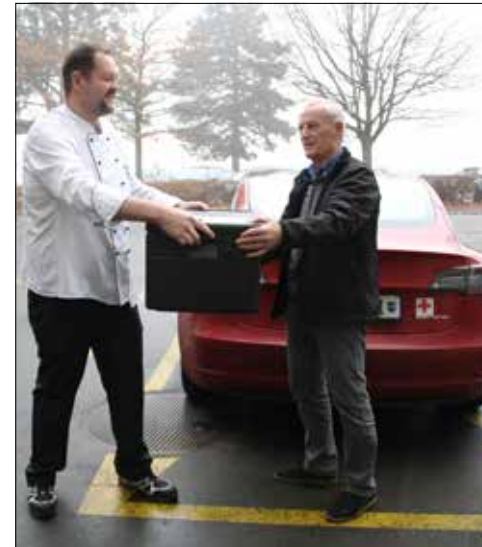
Übergabe der Essen an den Rotkreuz-Fahrer für die Auslieferung.

Das Asana Spital Menziken und das Aargauer Rote Kreuz spannen für den Mahlzeitendienst zusammen. Neu kann dank der Unterstützung des Rotkreuz-Fahrdiensts ein Lieferservice für den Mahlzeitendienst des Spitals angeboten werden.