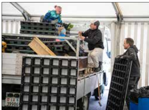
Die Schneebär steht kompakt. So, dass die Schalungselemente bereits wieder abgebaut werden können.

«Gift» für die Schneebär sind. Nun: Gütige Winterhilfe kommt meistenten aus dem Wynental. Genauer aus Reinach, wo bei der Eisreinigung des Hockeyfeldes in der Halle im Moos der benötigte Schnee anfällt. Rund sieben Kubik davon wurden auch in diesem Jahr wieder nach Seengen verfrachtet und dort in die mit Leichtbauschalungselementen ver-