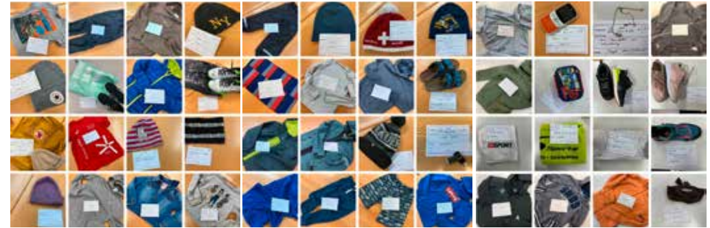
Eine kleine Auswahl von Fundgegenständen in der Schule Seengen, welche auf die Abholung durch die rechtmässigen Besitzer warten.