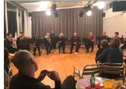
Von Cello und Klavier über Alphorn und Schwyzerörgeli zu Holz- und Blechblasinstrumenten: Der Konzertabend war in jeder Hinsicht vielfältig.

Erstes Konzert der erwachsenen Lernenden der Kreismusikschule Seengen und der Regionalen Musikschule Oberes Seetal.