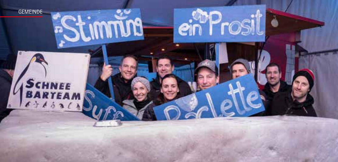
Das Seenger Schneebär-Team hat wieder ganze Arbeit geleistet und für das kurze Winterintermezzo alle Register gezogen.