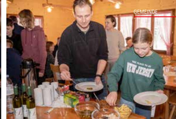
Gelungener Mitgliederanlass: Raclette und gemütliches Beisammensein stand in der Waldhütte Leutwil auf dem Programm.