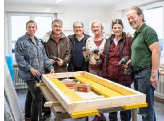
Das kleine und sehr engagierte Freiwilligen-Team beim Zimmern der Igelboxen in der Igelstation Dürrenäsch.