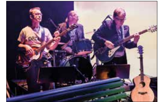
Das Theater Rigiblick lässt John Lennon aufleben.

In die erfolgreiche und unvergessliche Zeit der Beatles kann man am Samstag, 25. März 2023, um 20 Uhr eintauchen. Einmal mehr ist das Theater Rigiblick zu Gast und nimmt das Publikum mit seiner Produktion «Imagine – Tribute to John Lennon» auf