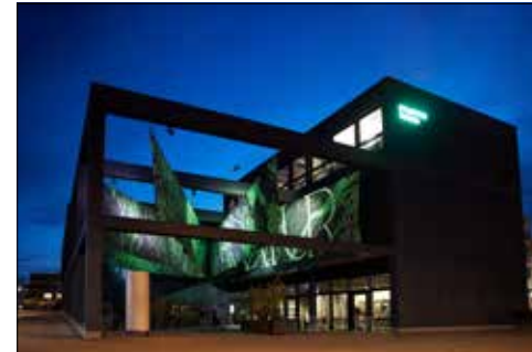
Das Stapferhaus am Bahnhof Lenzburg hat sich erneut verwandelt.

Im Stapferhaus in Lenzburg stehen die drängenden Fragen unserer Zeit im Fokus: Nach Geld, Heimat, Fake und Geschlecht widmet sich die aktuelle Ausstellung dem Thema Natur. Was oder wer ist Natur eigentlich? Wem gehört sie? Und müssen wir sie retten?