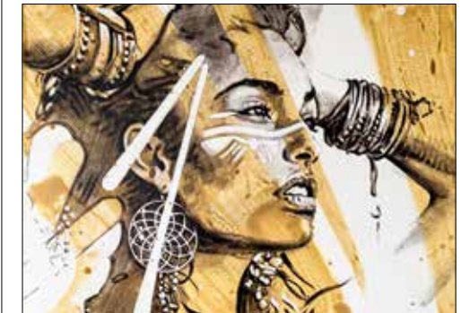
Bildausschnitt (Acryl auf Leinwand).

Tauchen Sie ein in eine analoge, sinnliche Welt, die in unserer modernen Zeit meist zu kurz kommt. Ein bestimmt empfehlenswerter Besuch, musikalisch untermalt von Tastenvirtuose Mega Horvath.