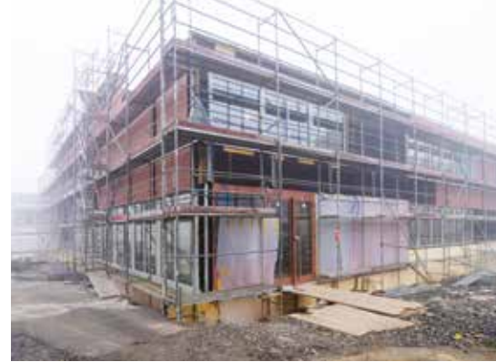
Das Schulgebäude «Polifonia» nimmt Formen an: Tagesstrukturleiterin ad interim, Katja Stark, freut sich auf die neuen Räume.

schroeder-ag.ch ■ Schorenstrasse 6 ■ 5734 Reinach