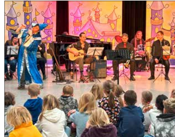
«Das Zauberschloss» – Aufführung vom Februar 2024.

Im August startet auch die Kreismusikschule Seetal in das neue Schuljahr 2024/2025. Jetzt ist die Zeit gekommen, nochmals zu schnuppern und sich für das gewählte Unterrichtsangebot anzumelden.