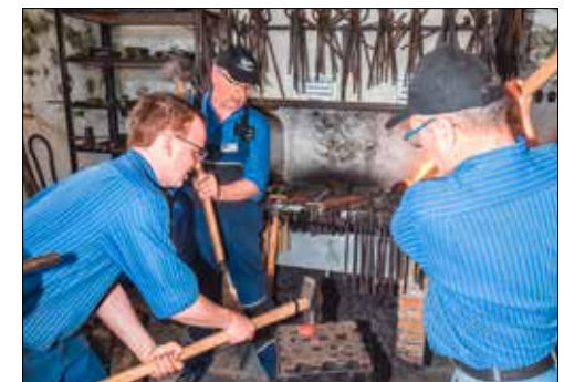
Ein Schmied und zwei Zuschläger.