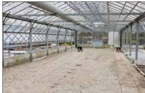
Die Gewächshäuser in Seon werden zu Verkaufsfläche umgestaltet.

Wer in Schafisheim den Standort der Gärtnerei Vogel als Privatkunde besucht, wird leider vorerst enttäuscht. Denn seit Anfang Jahr ist der Verkauf an Privatkunden dort geschlossen. Die Gärtnerei Vogel eröffnet jedoch am 19. April am nur wenige Kilometer entfernten Standort des Blumenladens in Seon die neu gestalteten Verkaufsflächen.