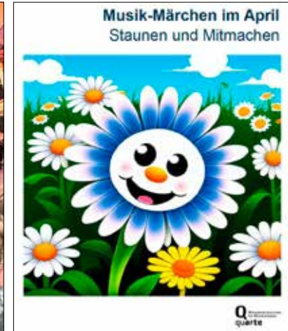
«Das neugierige Gänseblümchen» im Musiksaal Polifonia, Seengen.

(Eing.) – Das Team der KMS Seetal freut sich, auch im nächsten Schuljahr 2024/2025 zahlreiche neue und bisherige Musikschülerinnen und -schüler in der Welt der Musik begleiten zu dürfen. Mit einem Schnupperabo bietet sich in den kommenden Wochen bis zu den Frühlingsferien nochmals die Gelegenheit, ein Instrument auszuprobieren, bevor die definitive Anmeldung für das neue Schuljahr erfolgt. Die Anmeldung für alle Angebote wird über das Online-Portal auf der Website der KMS Seetal erfasst. Anmeldeschluss für das Schuljahr 2024/2025 ist der 30. April 2024.