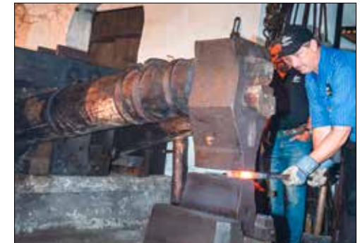
Der Bär trifft auf glühendes Eisen.