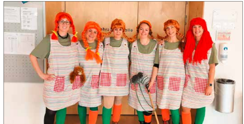
Das OK freut sich schon auf das nächste Jahr.