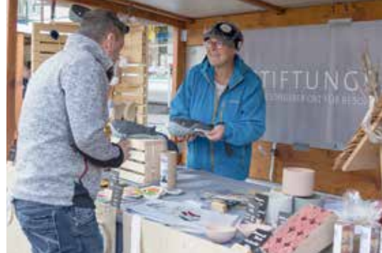
Der Herbstmarkt hatte wieder viel zu bieten. Auch die aktive Betätigung war dabei an diversen Ständen möglich.