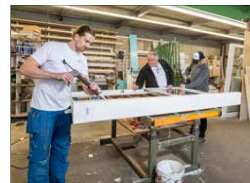
Vorbereitungen für die Fenster-Montagen in der Werkstatt.