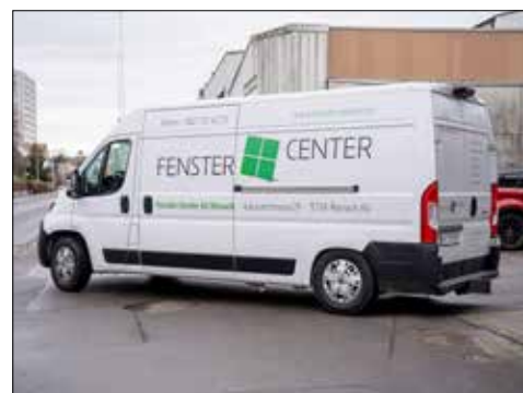
Die fahrende Werkstatt für Notfälle und Servicearbeiten.