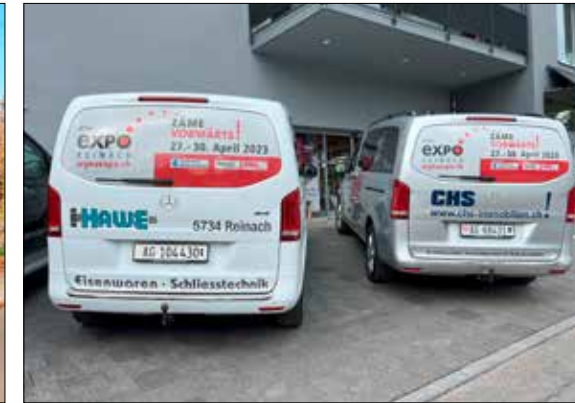
Der neueste Unimog wird an der WYNAexpo zu sehen sein. Die fahrenden Werbebotschafter (rechts) sind ab sofort unterwegs.