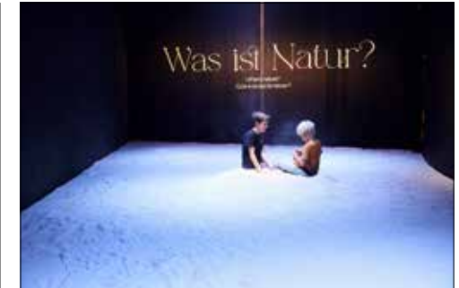
Spielerisches Entdecken der entscheidenden Frage unserer Zeit.

(Eing.) – «Natur. Und wir?» lädt zu einem poetischen Ausflug. Sie geht vom kritischen Zustand der Natur aus und führt zu einem neuen Blick auf sie. Und sie fordert dazu auf, das eigene Verhältnis zur Natur zu entdecken und mitzureden, wohin die Reise in Zukunft gehen soll.