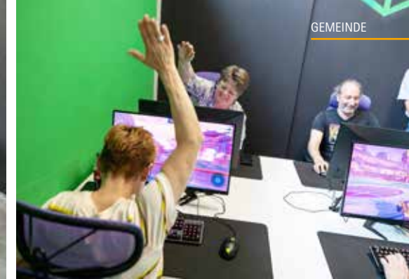
Grosses Jubeln und Abklatschen nach einem erfolgreichen Tor.