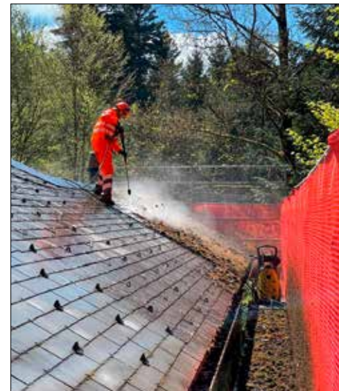
Zivilschützer befreit das Dach von Moos.

war beim Waldhaus Stierenberg in Reinach und hatte dort das Dach vom Moos gereinigt, die Regenrinne repariert und einige Stellen abgeschliffen und neu lackiert. Von der Partnerorganisation Feuerwehr Oberwylental hatte die ZSO den Auftrag erhalten, Sandsäcke auf Defekte zu prüfen und auf einer Schwerlastpalette neu zu stapeln.