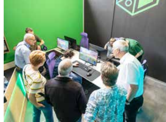
Kurze Instruktion des Spiels durch einen Jugendlichen.