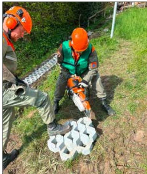
Zivilschützer beim Zuschneiden von Rasengittersteinen.

Im WK wurden die Pioniere in kleinere Arbeitsgruppen eingeteilt, welche unterschiedliche Aufträge erhielten. Eine Arbeitsgruppe hatte Waldwege in Zetzwil restauriert und die Bäche von Schwemmholz befreit. Zudem wurden die Hangstützen erneuert, damit der Waldweg bei starkem Regen nicht in den Bach geschwemmt wird. Eine zweite Arbeitsgruppe hatte sich um einen Wanderweg in Gontenschwil gekümmert. Der Kiesweg wurde ausgehoben, Rasengittersteine wurden verlegt, und die Regenrinne wurde vertieft, damit der Weg auch bei schlechtem Wetter sicher benutzt werden kann. Eine weitere Arbeitsgruppe