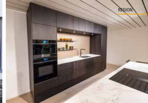
Neueste Küche im Showroom in Schongau.