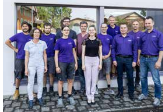
Ein Teil des Teams der Furrer Küchen AG.

Diese genannten Kurse sind nur einen Bruchteil des sehr abwechslungsreichen und interessanten Programms. Auf der Homepage der Volkshochschule Wynental ( www.vhs-wyntental.ch ) finden sich alle Angebote der kommenden Saison. Der Vorstand freut sich über ein zahlreiches Besuchen der Kurse.