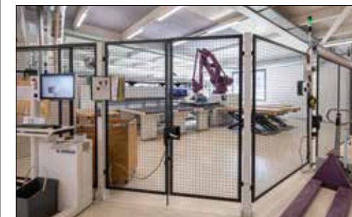
Vollautomatischer Zuschnitt der Einzelteile durch den Roboter.

fertig eingerichtete Küche sind bei der Furrer Küchen AG hoch. In der Ausstellung in Schongau oder in der Bauarena Volketswil kann die hohe Qualität begutachtet werden. Neben den Küchen entstehen je nach Kundenwunsch auch Bäder, Schrankanlagen, Garderoben, Tische oder Sideboards. Aber auch für weitere spezielle Wünsche ist man immer bereit. Ob für die anspruchsvolle Materialwahl oder den verwinkelten Raum, eine passende Lösung wird bei den Schongauer Holzprofis immer gefunden. Über eine Kontaktaufnahme freut sich das gesamte Team.