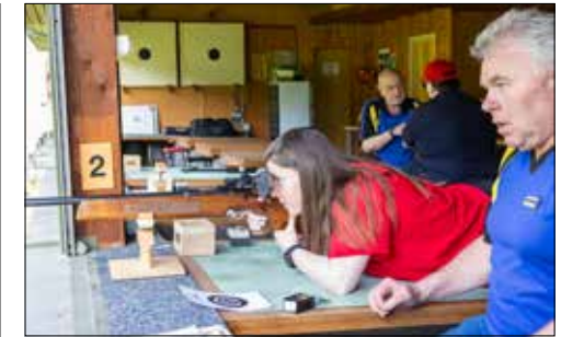
Fachkundig wurde der Schiesssport nähergebracht.

(dah) – Der Schweizer Schiesssportverband feiert in diesem Jahr sein 200-jähriges Jubiläum. Aus diesem Grund wurden am Samstag, 13. April, in der ganzen Schweiz die Schützenhäuser geöffnet, um der Bevölkerung den Schiesssport näherzubringen. So auch bei den Sportschützen Teufenthal, welche im letzten Jahr ihr 100-jähriges Jubiläum feiern durften. Im Schützenhaus im Industriequartier Feldmatte wird mit Kleinkaliber-Waffen auf eine Distanz von 50 Metern geschossen. Die rund 15 Mitglieder im Verein, davon zwölf Aktivmitglieder, fördern und erhalten gemeinsam das sportliche Schiessen und messen sich in verschiedenen regionalen wie auch überregionalen Wettkämpfen. Ebenso pflegen sie die Kameradschaft etwa in einer gemütlichen Runde nach dem Schiessen in ihrer Schützenstube. Das jährliche Volks- und Firmenschiessen Ende August und Anfang September darf im Vereinskalendar auch nicht fehlen. So konnte der Verein im Jubiläumsjahr die grösste Beteiligung im Kanton Aargau verzeichnen. 365 Schützen traten in Gruppen oder