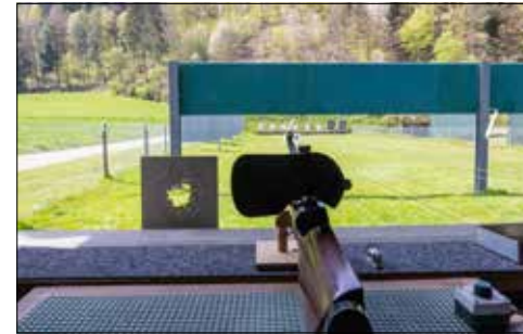
Idyllische Aussicht aus dem Schützenhaus auf die Zielscheiben.

Am Samstag, dem 13. April, wurden anlässlich des 200-jährigen Jubiläums des Schweizer Schiesssportverbandes in der gesamten Schweiz die Schützenhäuser geöffnet. So auch bei den Sportschützen Teufenthal im Industriequartier Feldmatte.