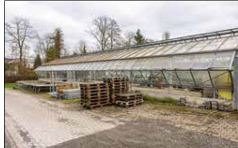
Nahegelegene Parkplätze ermöglichen einfaches Einladen.

Diese Veränderung bringt auch Vorteile, denn nun können die Flächen in Schafisheim ausschliesslich für die Produktion der Pflanzen genutzt werden, was eine noch effizientere Arbeitsweise und eine bessere Qualität der Ware begünstigt. Das Sortiment kann zudem noch weiter ausgebaut werden, um den Kundinnen und Kunden noch mehr zu bieten. In Seon ergibt sich dadurch mehr Platz für Verkaufsflächen. Die Umgestaltung der bestehenden Gewächshäuser und Flächen läuft aktuell auf Hochtouren, damit am 19. April die Eröffnung des Gärtnereiverkaufs stattfinden kann. Ab diesem