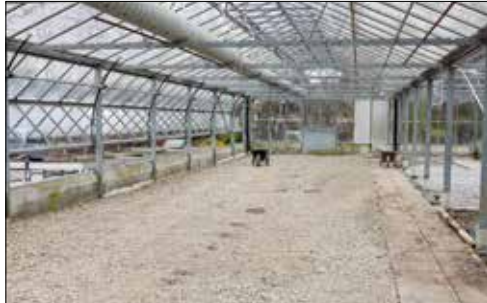
Die Gewächshäuser in Seon werden zu Verkaufsfläche umgestaltet.

Wer in Schafisheim den Standort der Gärtnerei Vogel als Privatkunde besucht, wird leider vorerst enttäuscht. Denn seit Anfang Jahr ist der Verkauf an Privatkunden dort geschlossen. Die Gärtnerei Vogel eröffnet jedoch am 19. April am nur wenige Kilometer entfernten Standort des Blumenladens in Seon die neu gestalteten Verkaufsflächen.