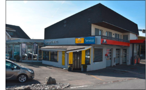
Garage Graf AG, Zetzwil (2017).