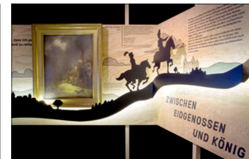
Blick in die Sonderausstellung «Zwei Hallwyler am französischen Hof».