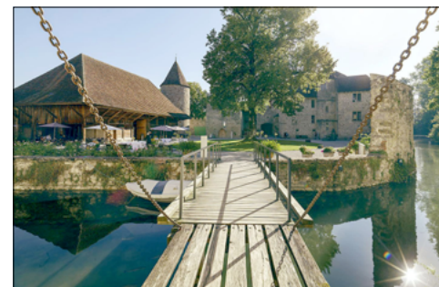
Das Schloss Hallwyl schaut auf eine lange Familiengeschichte zurück.

Ausstellung zum Jahresthema «Kaiser, Könige und Königin» im Museum Aargau. Dietrich von Hallwyl entwickelte sich im 15. Jahrhundert am Hof von Louis XI vom Pagen zum Vertrauten des Königs. Auch sein Bruder Hans startete am französischen Hof durch. Abenteuer, Krieg und Freundschaft begleiteten ihren Weg.