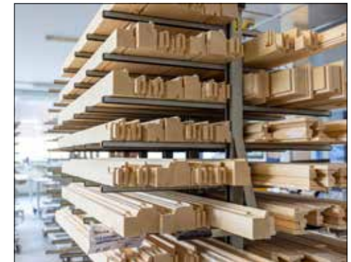
Das verwendete Holz stammt zu 100% aus Schweizer Wäldern.

(dah) – Wer einen Neubau oder eine Renovation plant, beschäftigt sich zwangsläufig auch mit den Themen Fenster und Türen. Energieeffizienz und die Ästhetik der Liegenschaft spielen dabei eine zentrale Rolle. Genau darum kommt das speziell entwickelte Fenstersystem Fenlife zum Zug, welches die Stutz Fensterbau – Schreinerei AG 2006 in Zusammenarbeit mit drei weiteren Schweizer Fensterfirmen in den Markt eingeführt hat. Das System bietet Flexibilität und Schnelligkeit, um die Kundenwünsche zu vollster Zufriedenheit umzusetzen. Die Herstellung der individuellen Fenster erfolgt in Schongau selbst und wird ausschliesslich mit Holz aus Schweizer Wäldern hergestellt. Somit erfüllt die Gesamtproduktion die Anforderungen für das Herkunftszeichen «Schweizer Holz». Die restlichen Materialien für die Holz- und Holz-Metall-Fenster, Schiebetüren und Haustüren werden, wo es geht, auch aus der Schweiz bezogen. Der rücksichtsvolle Umgang mit der Umwelt