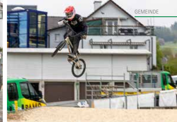
Spektakuläre Sprünge während des Trainings gehören auch dazu.